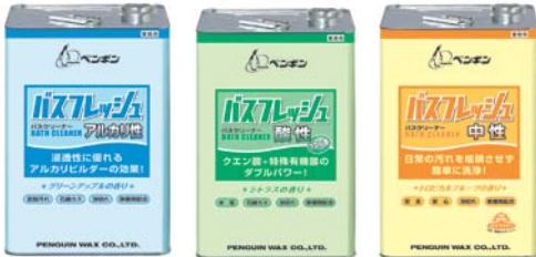
アルカリ性 酸性 中性 原液～10倍希釈